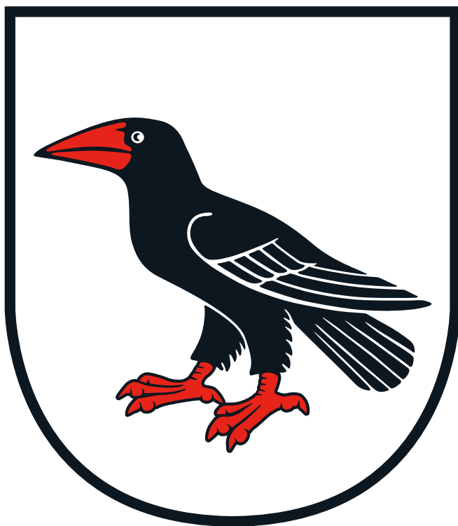
Vrána v erbu