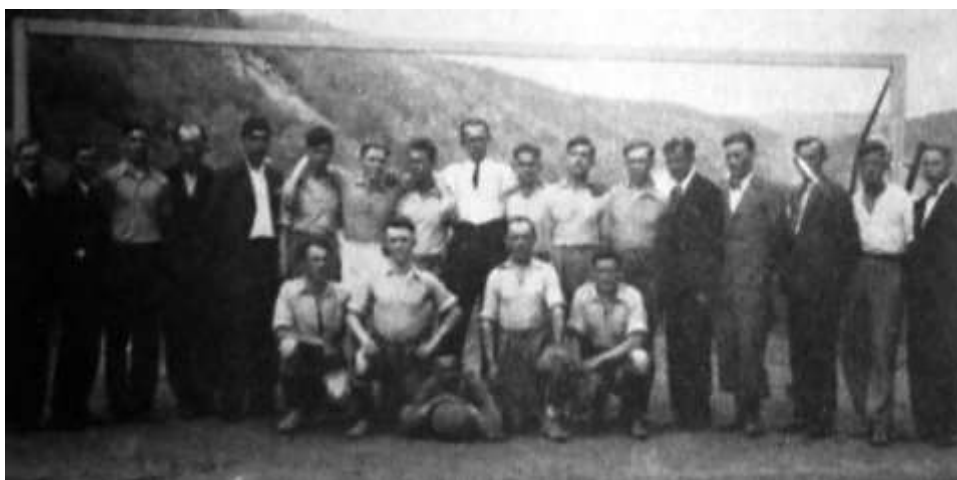
Tým S.K. Roztoky na dobové fotografii z roku 1933.