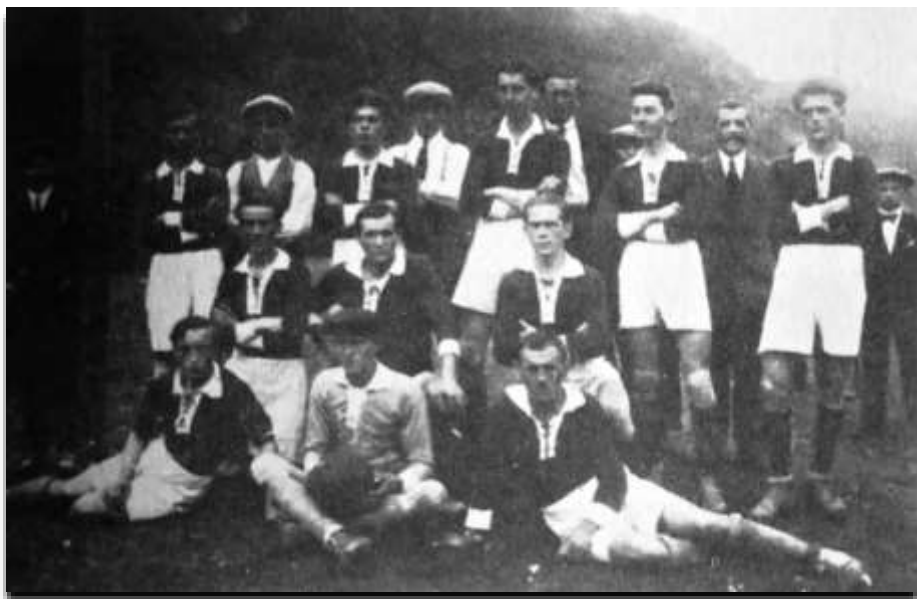
Nejstarší dochovaná fotografie S.K. Roztoky z roku 1929.

Jak bylo předesláno v předcházející kapitole, zapustila kopaná v Roztokách na počátku 30. let pevně své kořeny a začínala přinášet první plody. Roztočtí fotbalisté se stávali vyhledávaným soupeřem. Utkávali se v rámci župní soutěže s mnohými protivníky zvučných jmen. Do Roztok zajížděla mužstva z Berouna, Litně, Nového Knína, Mýta, Kařezu, Lochovic, Srbska,