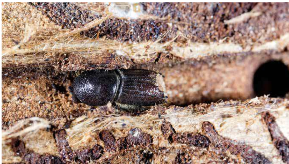
Lýkožrout smrkový (laicky se mu říká kůrovec), vědecké jméno: Ips typographus

Dovolte, abych se představil. Mé jméno je lýkožrout smrkový, ale nikdo mi už dlouhá léta neřekne jinak než kůrovec. Žiju v evropských lesích už tisíce let, ale takovou legraci jako vloni, tak to jsem ještě nezažil. Lidi, vy jste tak zábavná forma života, fakt... Co já o sobě poslední léta všechno slyšel... Nejnovější hit je, že národní parky a konkrétně třeba NP České Švýcarsko, můžou za rozšíření mé populace. Koho taková pitomost napadne, to mi tedy řekněte! Myslím, že by bylo načase, abych se do těch lidských debat vložil i já a uvedl to na pravou míru.