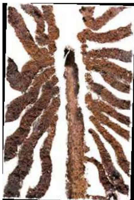
Typické požerky lýkožrouta smrkového

Já jsem prosím celkem mírumilovný a dá se se mnou docela dobře vyjít. Zdravý smrk v mírném klimatu se mi povětšinou ubrání. Jsou ale roky, kdy – a to nezastírám – mě to popadne a já žeru jak nezavřený. To pěkně prosím úplně stačí, když lesem proletí dvě tři vichřice a nechají vyvrácené a zlámané stromy. A když se k tomu ještě přidá počasí, jaké bylo tuhle, tak to mě nikdo neudrží. Hele – od dubna třicetistupňová vedra, sucho až do konce podzimu... Já stihnul za rok vyvést hnedle tři generace! A všichni žrali, co to šlo. V podstatě výhradně smrky, ty nám prostě chutnají. A vy prej, že národní park... Víte, co oni proti nám všechno dělají? Před dvaceti lety, když národní park České Švýcarsko vznikl, byli všichni celí pryč z unikátní krajiny pískovcových Národní park Národní park skal a výjimečných biotopů. Jen některým ale došlo, že lesy, které tu jsou, jsou něco jako časovaná bomba. Když se totiž zhruba před sto lety přemnožila kolegyně bekyně mniška, odumřely stromy na obrovských plochách a musely se vykácet. Kdybyste viděli, jak to vypadalo třeba kolem Gabrieliny stezky! Tam nezůstal jediný strom, jen holé skály. No, a lidi se tehdy