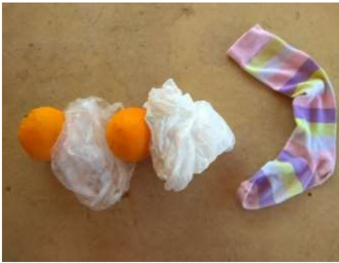
Najdi název knihy.