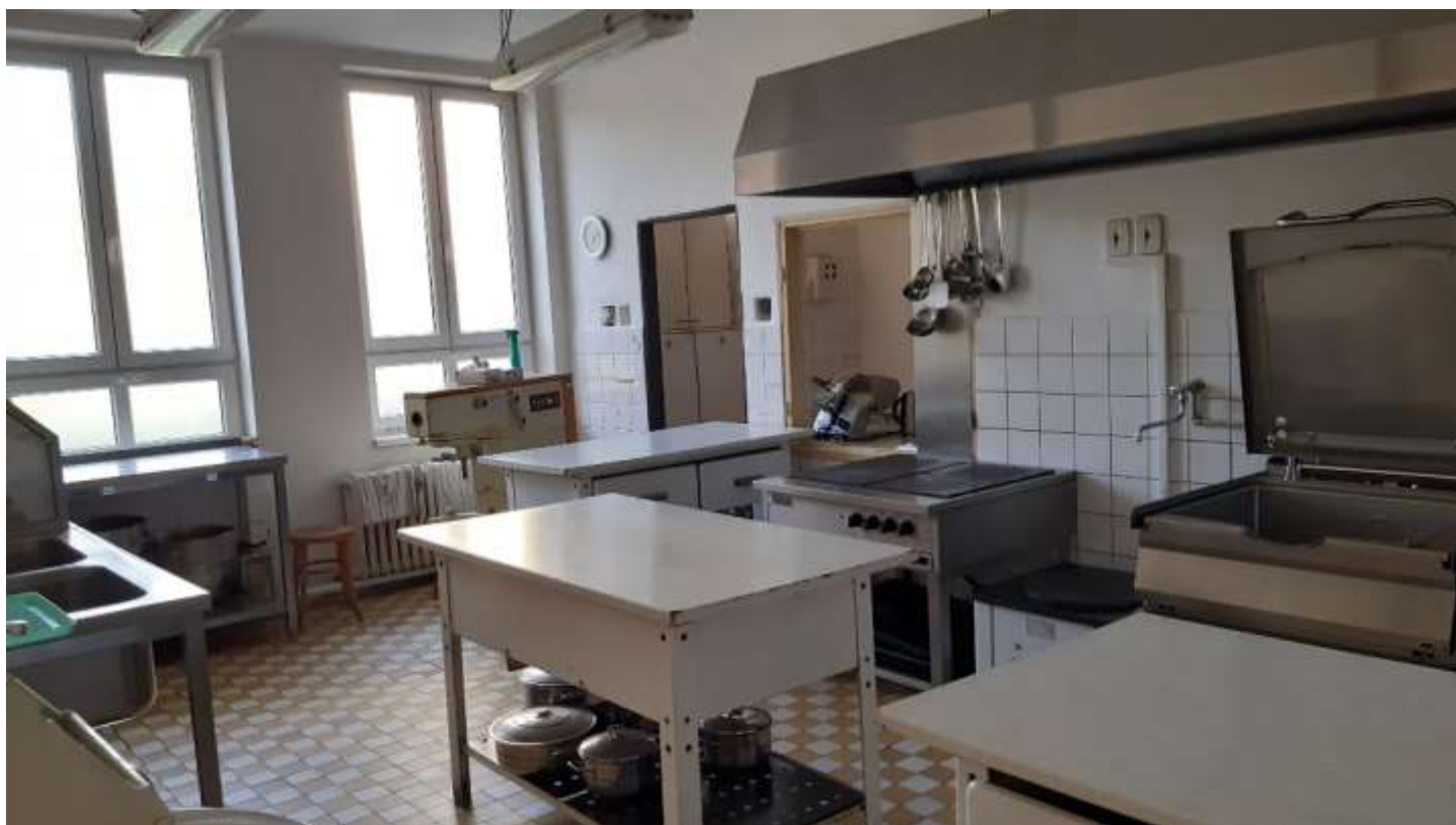
Kuchyně před rekonstrukcí