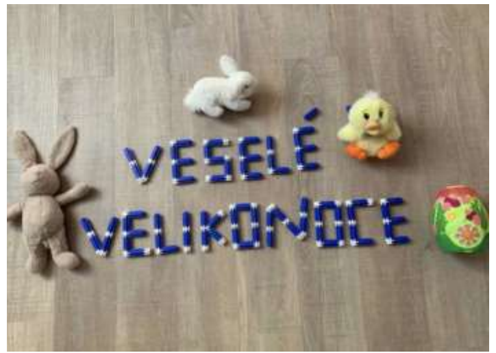
Sestav velikonoční pozdrav.

U nás ve druhé třídě se setkávám pravidelně nad učením s osmi žáky (z 11). Díky produktu Flexibooks (Fraus) můžeme spolu procvičovat v pracovním sešitě i učebnici. Vše, co právě děláme, vidí děti na svých monitorech. Zjistila jsem s radostí, že tímto způsobem zvládáme dokonce i novou látku, slovní druhy. Část práce dodělají poté děti samy doma. A že opravdu plní svoje úkoly, se přesvědčuji pravidelně, když vybrané stránky či cvičení posílají jejich rodiče elektronicky zpět. Poskytuji tak dětem i motivující hodnocení. Vím, že je to hodně na rodičích, vždyť třeba pravidelné trénování čtení je jen a jen na nich. Zaslouhují náš dík i pochvalu. I pro nás platí věta, kterou jsme v posledních dnech už slyšeli mnohokrát: SPOLEČNĚ TO ZVLÁDNEME!